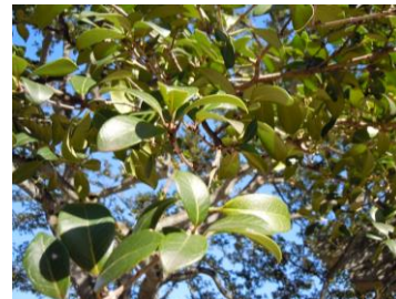
時を経て丸くなったヒイラギの葉