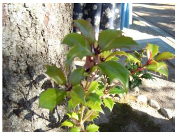
神社内にあるヒイラギの大木